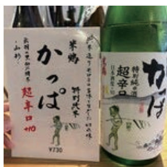
米鶴 かつば ¥730

辛口のおすすめのお酒。爽や かな香りと、清々しさを感じ ながらも、柔らかく軽快な 味わいです。