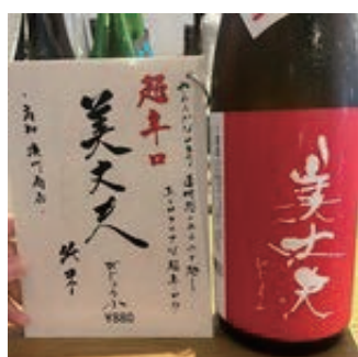
美丈夫 純米超辛口 ¥880